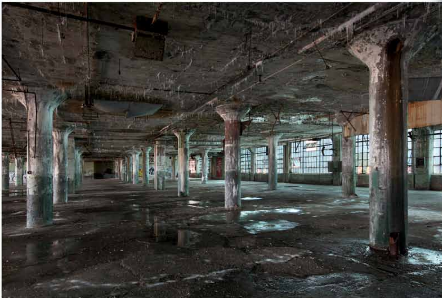
工厂 美国 2009