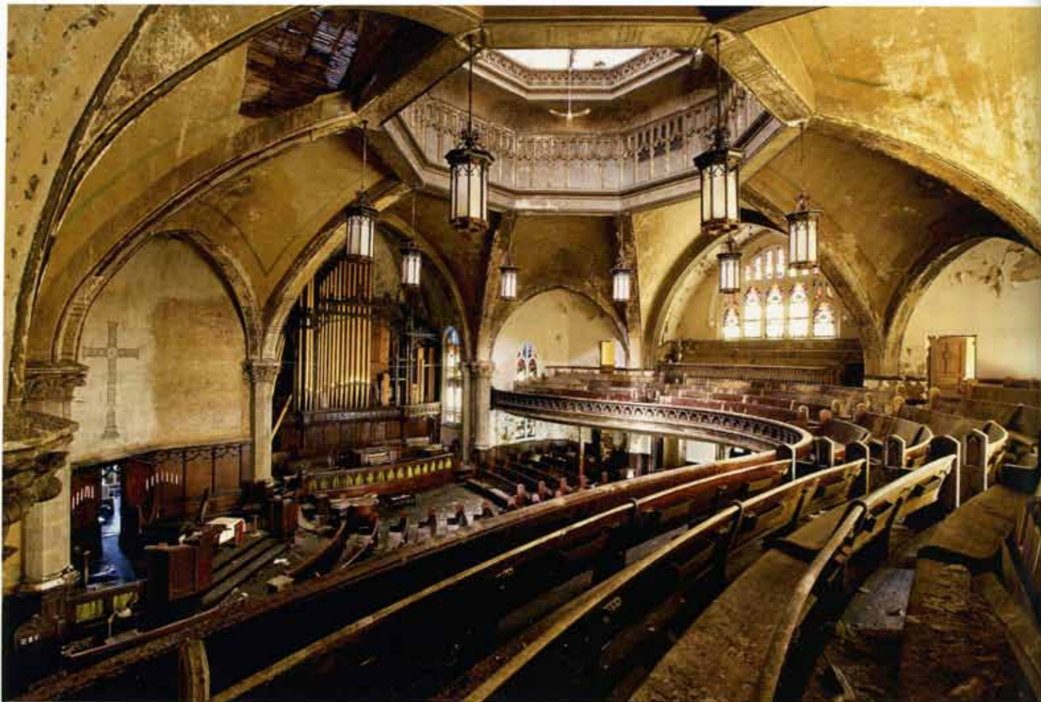
教堂 美国 2009