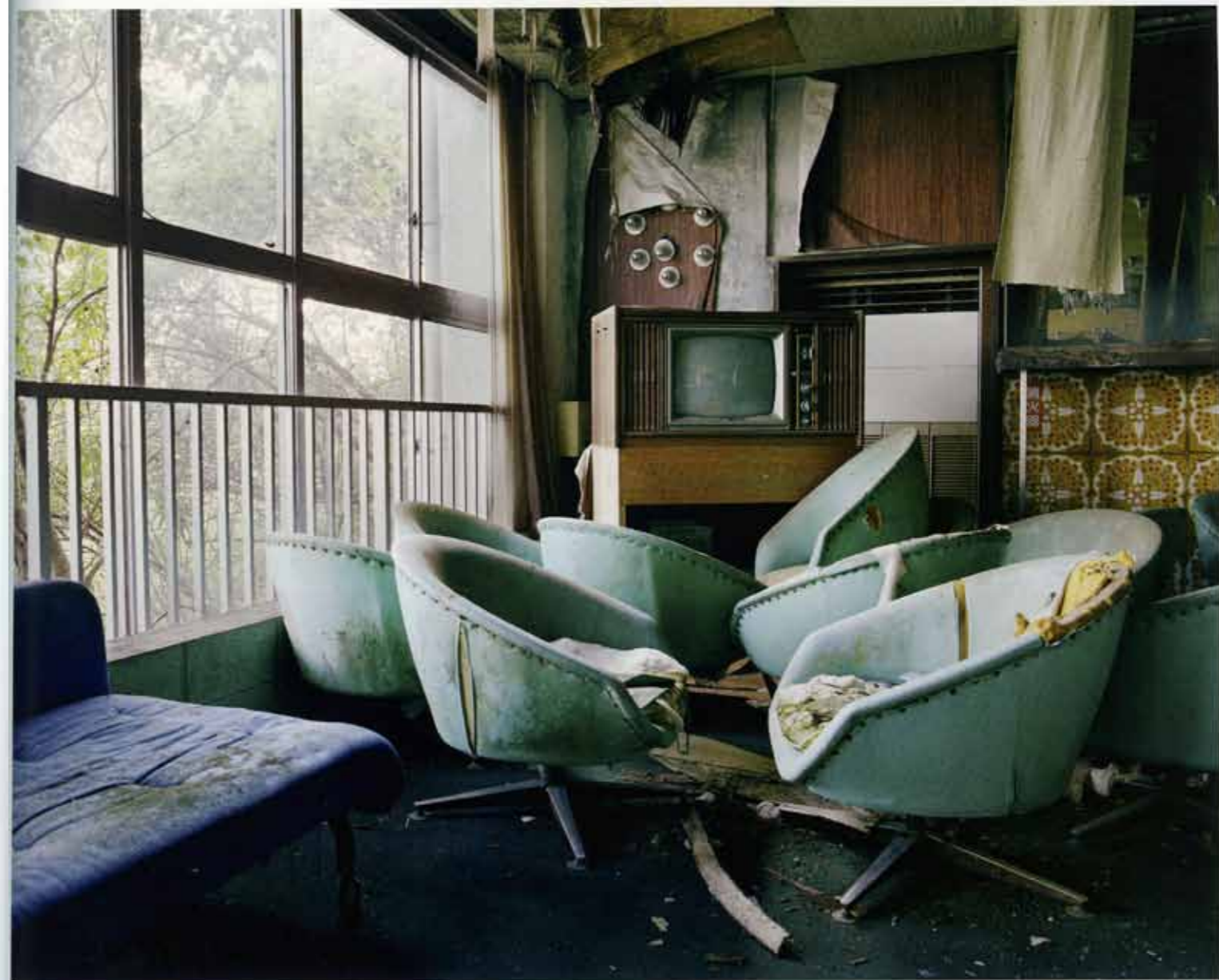
酒店 日本 2009