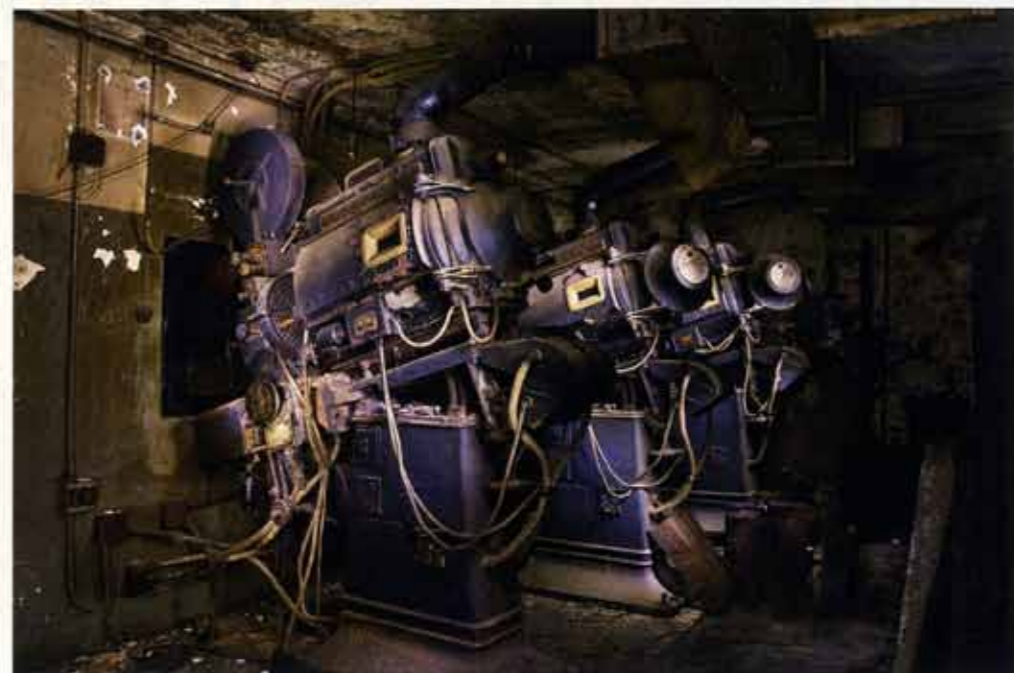
电影院 美国 2007

托马斯·乔瑞昂 生于1976年，目前生活和工作于巴黎。他的作品主要聚焦于城市废墟和报废的建筑空间，引导观者思考物体与时间的关系。作品曾入选Bourse du talent #44 Landscape, Critical mass Top 50, Archiphot等摄影比赛。