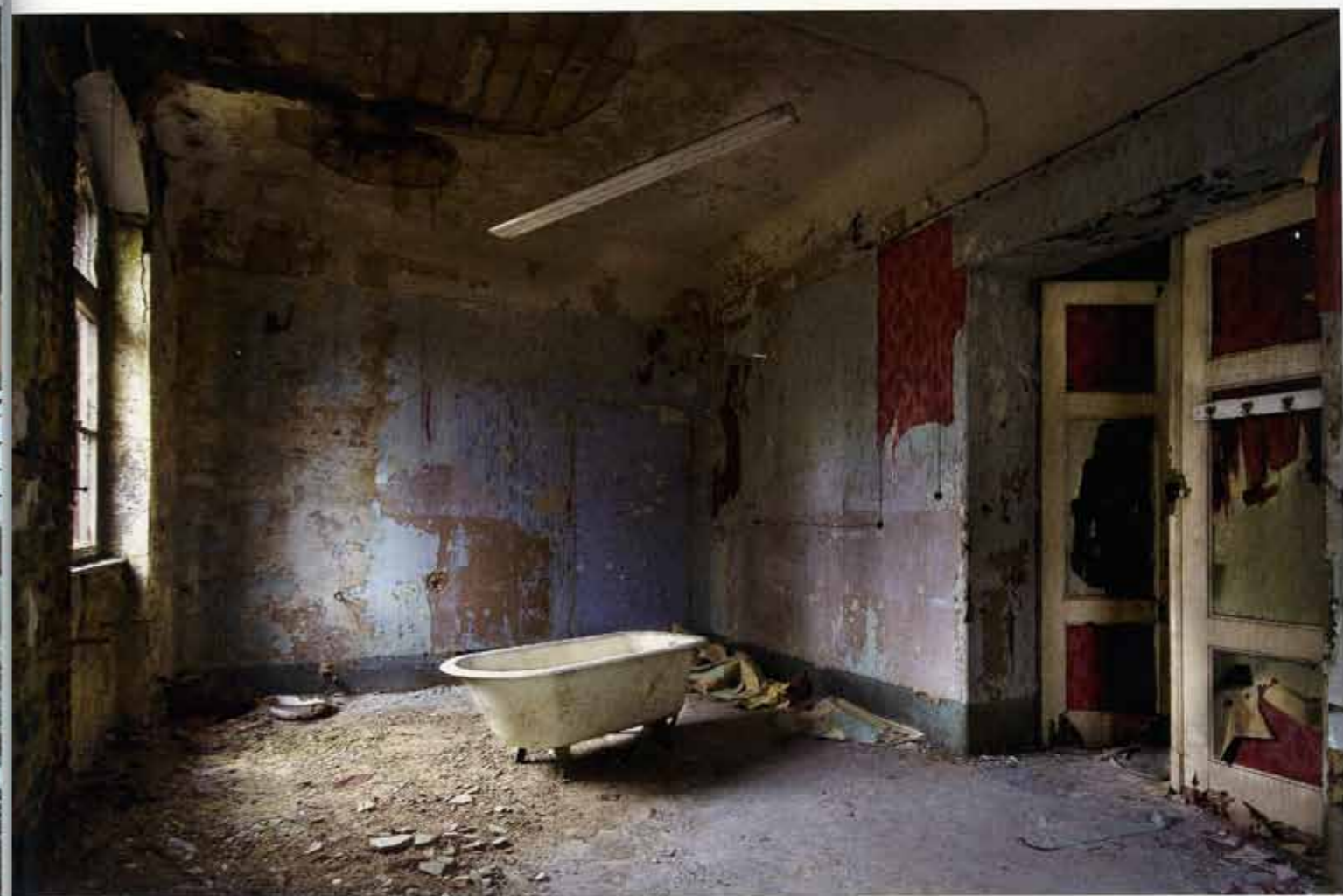
军事医院 德国 2008

举凡世上事物的存在状态，新只是暂时的，旧则是长期的。建筑空间在短暂的全新之后，便进入日陈月异的折旧形态。直至废弃。而被弃置的废墟遗迹，周遭遗体尽显过去时光的斑驳划痕。时间在这地界呈显一袭停滞的凝固。空间的新与旧，在时间轴上滑到了存在的尽头。此际尘封了的时空，犹如残梅一般虽已零落成泥碾作尘，却仍有香如故。这样一股暗香，恰可为“留得残荷听雨声”。托马斯·乔瑞昂悟得此中的艺术玄机，于是藉由废墟和遗址的残败之像，舞弄一派残缺美的淋漓气象，划出一道决然出世