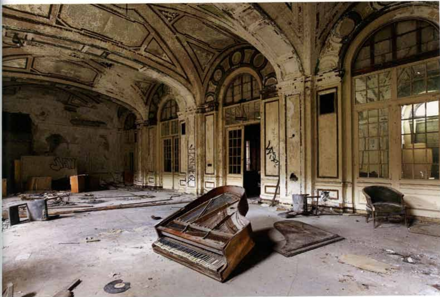
酒店 美国 2009

“我的工作是基于我们对时间的感知，它如何传递，尤其是其非线性的展现。随着时间的推移，有些地方似乎已沦于冷藏状态。虽然我们的社会发展和变化非常迅速，这些地方显示出了被过去时间的扭曲情形。它们似乎是毫无生气，或处于一种觉醒状态，然而在现实之中，它们将其自身与时间相连接。”